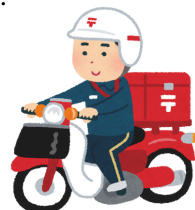
前職時代の私です（イメージ）

遊佐町の出身の方との結婚を機に遊佐町へ参りました。前職は郵便屋さんで、東京都内でバイクを乗り回して配達をしていました。人と関わることが好きで、様々な方と会いましたが、そのご縁に今も感謝して生きています！人生死ぬまで勉強だと自分に言い聞かせ、新しい事にチャレンジしに協力隊へ参加させていただきました！！