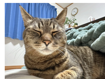
実家の愛猫、ぶーちゃん