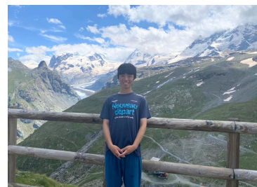
マッターホルンに登りました