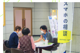
▲記念すべきスマホ道場 1日目の様子