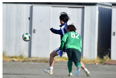
サッカーはじめ、運動少年です

現在横浜国立大学教育学部3回目の4年生として、二足の草鞋を履かせていただいています。昨年、デンマークの学校で一年間ボランティア教員として働き、その経験を残りの大学生活通して活かせる場所を探していたところ、遊佐高プロジェクトを拝見し、即応募、現在に至ります。