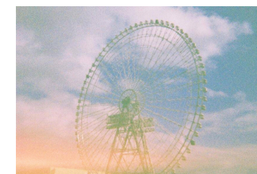
フィルムカメラで 写真を撮ったりしてます

昨年からは遊佐町で活動していただいたので、どこかで私のことを見たことがある方もいると思います！ついに胸を張って遊佐町民と言えるようになりました！遊佐町の大自然と町の皆様の温かさに感謝しながら、日々精進して参ります。どうぞよろしくお願いいたします！