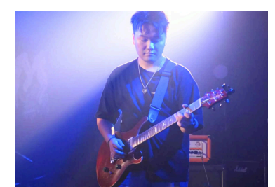
大学時代はバンドをしてました

2024年の3月に遊佐町でのインターンシップに参加したことがきっかけで遊佐町に住みたいと思いました。その後1年間遊佐町にほぼ毎日通い続け、大学卒業後の進路として遊佐町で地域のために活動したいと考え、協力隊へ応募しました！